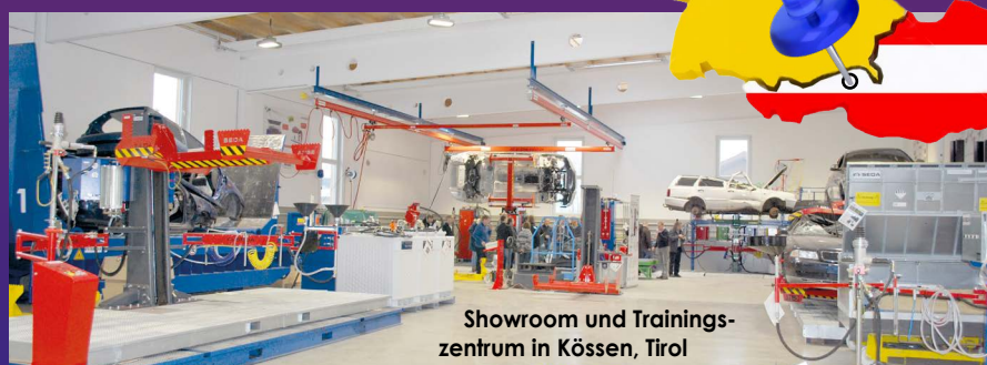
Showroom und Trainingszentrum in Kössen, Tirol