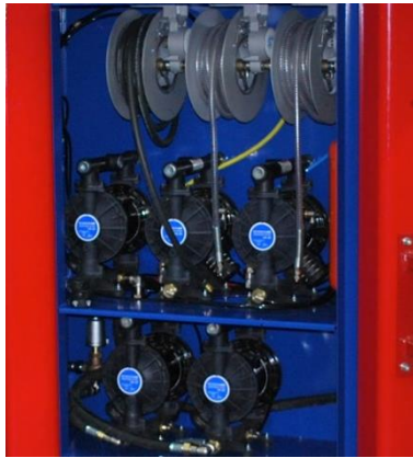
Entegre pompa sistemi