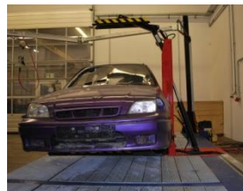
Step 1: Auto plaatsen