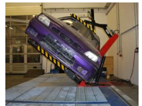
Step 3: Auto draaien