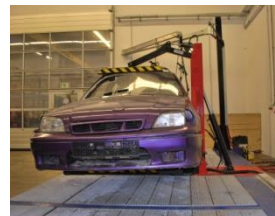
Step 2: Auto beveiligen