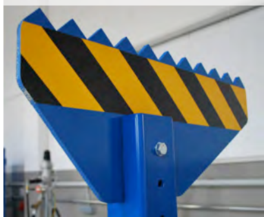
sterke voertuig houders