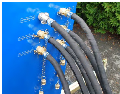
Vooraf geïnstalleerd snelkoppelingen voor tank lijn