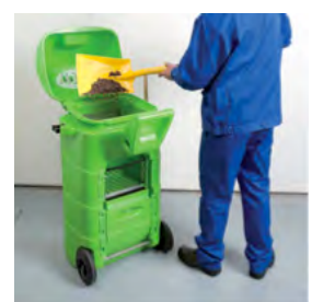
Sammeln und recyceln