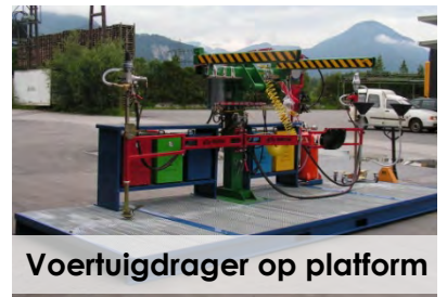
Voertuigdrager op platform