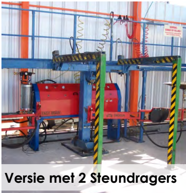
Versie met 2 Steundragers

Voor de maximale gebruik van de ruimte onder de auto, is de juiste keuze van de voertuig drager belangrijk. Door de hydraulische lift wordt voor het booren een diepste punt mogelijk gemaakt, dus kunnen 1-2 liter brandstof meer verwijderd worden. Zo kunnen we een Droogleggingspercentage tot 98% bereiken. De stabiliteit kan worden vergroot door twee verdere liggers.