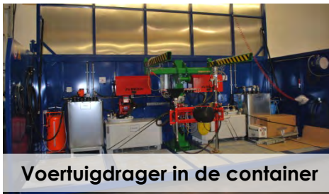
Voertuigdrager in de container