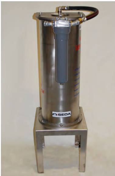
Water Separator blank