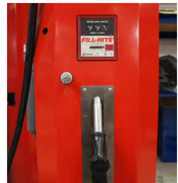
Tanksysteem met display

De brandstof kan ook voor het tanken worden gebruikt met een geïntegreerd doseersysteem. Bovendien kan de inrichting ook condensatie water uit tanks filteren.